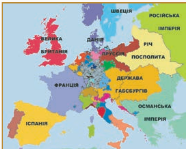
Європа у 1789 році

великими періодами в історії людства, що їх учені називають раннім та пізнім Новим часом . Межу між ними, щоправда, можна провести по-різному. Для історії техніки, технологій та господарства точкою відліку