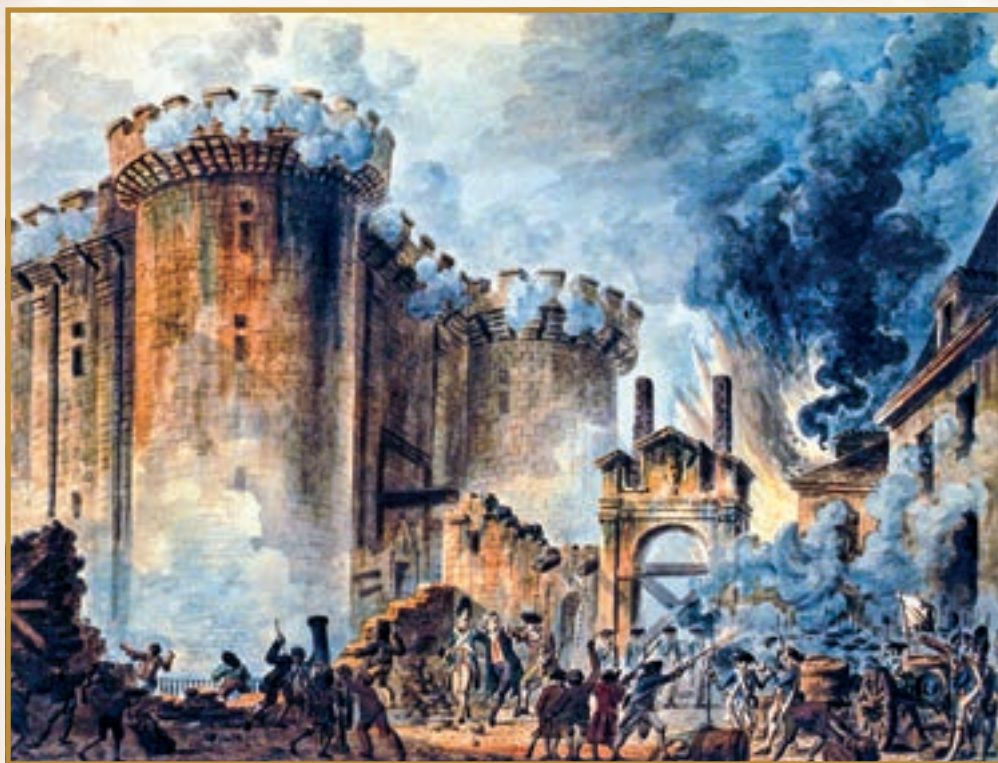
Здобуття Бастилії. Малюнок XVIII ст.

разом із працівниками своїх банків, але більшість складали люди незаможні, так звані санкюлоти (тобто ті, хто ходив без санкюлотів — штанів особливого, «шляхетського» крою). Гвардійці спочатку не мали зброї. Але невдовзі натовп захопив арсенал, здобув рушниці та гармати і 14 липня 1789 року взяв штурмом фортецю Бастилію , яка панувала над східними передмістями столиці. Коли про падіння Бастилії повідомили королю, він вигукнув, що це бунт. «Ні, Ваша Величносте, — заперечив монар-