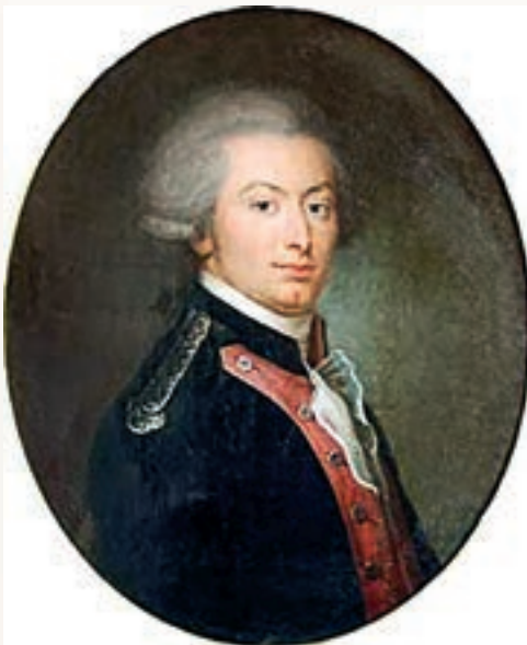
Жільбер Лафайєт. Портрет Дж. Опі (Приватна колекція)

но, що символом революції став « національний трико́лор » — об'єднати кольори Парижа (червоний і синій) та королівської династії (білий) запропонував маркіз Жільбер Лафайєт , керівник Національної гвардії, героєм війни за незалежність США