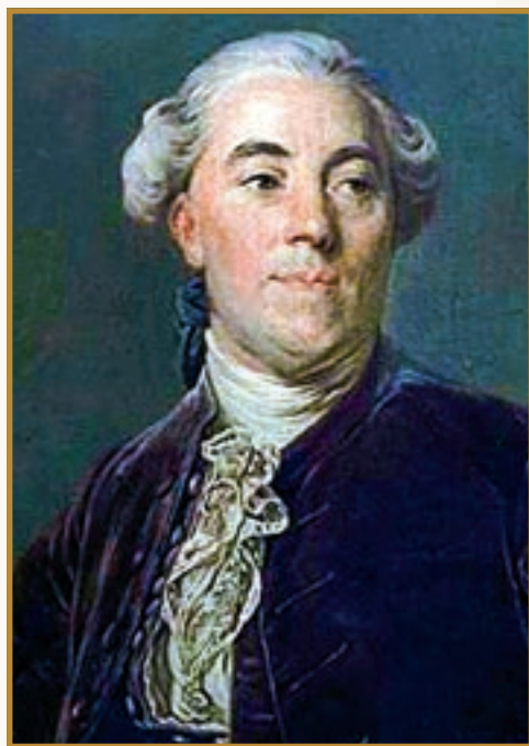
Жак Неккер. Портрет Ж. Дюплессі (Музей Версаля)

Судові палати, в яких панували вихідці з буржуазії, як могли, опиралися запровадженню нових податків. Король міняв одного контролера фінансів за іншим. Замість Тюрго він призначив на цю посаду банкіра Жака Неккера — попри те, що