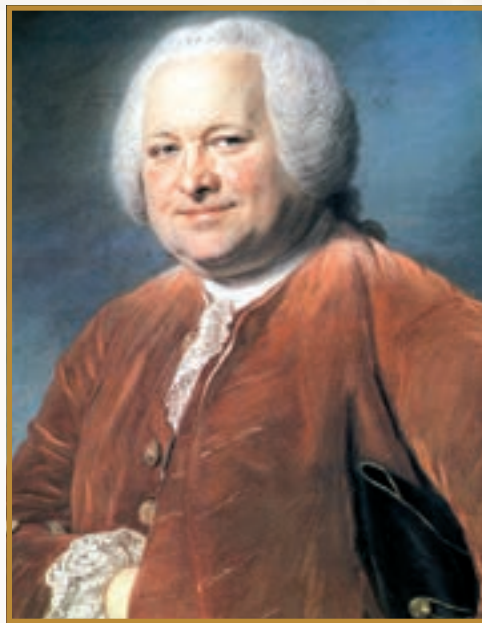
Жан-Жозеф Ле Пуплін'єр — генеральний відкупник Франції. Портрет М. Лятура ( Музей Версаля )

інші залишки феодалізму стримували розвиток промисловості і торгівлі. Підприємці охочіше займалися фінансовими операціями. Вигідним застосуванням капіталу вважали відкупи — коли багатії купували в держави право збирати податки від її імені. Чималі відсотки платили й за державними цінними паперами. XVIII сторіччя стало добою швидкого збагачення французької буржуазії та посилення її впливу в суспільстві. Навіть союз абсолютистської Франції з США пояснювали не лише бажанням короля помститися давньому супротивнику — Британії, але й інтересами торгівців Бордо і Нанта, промисловців Парижа і Ліона, які шукали нові ринки замість втрачених французьких колоній в Індії та Північній Америці.