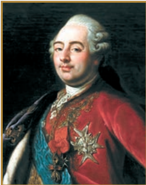
Людовик XVI. Портрет невідомого автора (Художній музей Сан-Паулу)

підприємців і надалі — разом з селянами та робітниками — зараховували до третього, «податного» стану, а відтак вважали людьми нижчого гатунку. Навіть найзаможніші буржуа не могли займати високі державні та військові посади. Тим більше обурення викликали привілеї «вищих» станів, що їх за доби Просвітництва вважали непродуктивними . За французькими законами духовенство і шляхта не сплачували податків, але при цьому вони ще й отримували різноманітні подарунки та виплати з королівської скарбниці, яку мали наповнювати представники третього стану. Звичайно, державні кошти витра-