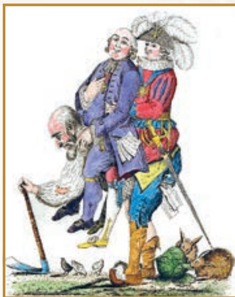
Три стани. Карикатура XVIII ст.

2. Від скликання Генеральних штатів до штурму Бастилії. За часів Середньовіччя делегати від кожного стану не лише обиралися, але й збиралися та голосували окремо. Це забезпечувало перевагу в Генеральних штатах «вищих» станів — духовенства і шляхти. Проте буржуазію наразі це не влаштовувало. Її настрі висловив Емануель Сійєс . У памфлеті « Що таке третій стан? » він доводив: оскільки до «нижчого» стану належить 96% французів, його цілком можна ототожнювати з народом або нацією загалом. Підприємці вима-