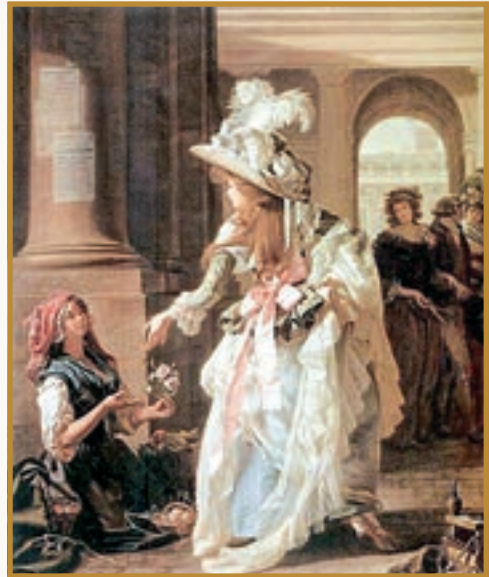
Панянка і продавчиня квітів. Картина М. Гарньє (Приватна колекція)

Наприкінці XVIII сторіччя Франція залишалася найбільшою державою Європи за чисельністю мешканців. Більшість з 25 мільйонів підданих Людовика XVI були дрібними господарями — селянами. Земля, натомість, належала великим власникам — шляхті та церкві. Власне господарство шляхтичі зазвичай не вели, а селяни за користування своїми ділянками мусили сплачувати грошовий оброк та частину врожаю, іноді — відробляти панщину. Панство мало й інші привілеї, зокрема право полювати на орних землях. Шляхта звикла до за-