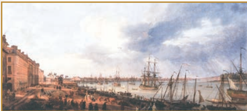
Порт Бордо. Картина М. Верне ( Морський музей Франції )

Разом із багатством, щоправда, зростало й невдоволення французької буржуазії її упослідженим становищем в суспільстві. Адже