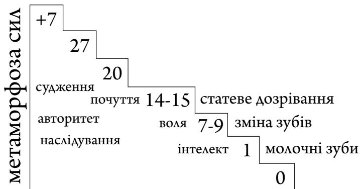
Рис. 3. Етапи розвитку людини

Штайнер підкреслював, що період формування власних суджень важливий і пов'язаний із статевим дозріванням. На його думку, розвиток у межах кожної семирічки – ключовий для якості перебігу наступної. Таким чином, до-рослішання дитини та перехід з одного етапу на інший відбувається фазово кожні сім років, і якість кожного наступного етапу розвитку залежить від якості перебігу попереднього (рис. 3).