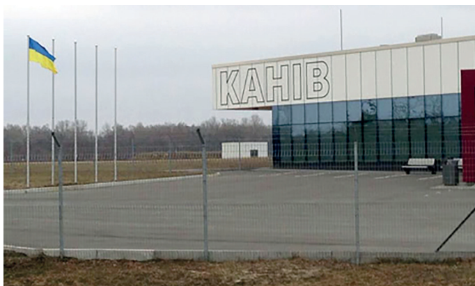
Гелікоптерний майданчик біля Канева

майданчик. Перше, що кинулося в очі, – п'ять високих флагштоків біля терміналу. На одному з них майорів прапор України, інші були вільними. «Які тут можуть бути сумніви?» – подумав я. Об'єкт, безумовно, призначений для прийому іноземних делегацій!