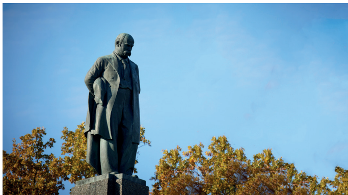
Пам'ятник Тарасові Шевченку на Чернечій горі в Каневі

Відзначати ювілей Шевченка можна було по-різному. Наприклад, улаштувати урочисті збори в Палаці «Україна» в Києві, або в Державному Кремлівському палаці. Але найголовніші заходи – і читач зі мною погодиться – безсумнівно, мали відбутися в місті Каневі, біля могили поета. На Чернечій горі 3 , там, де він заповів поховати свій прах і згадати його колись «в сім'ї великій, в сім'ї вольній, новій».