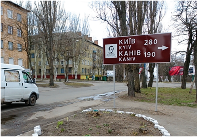
Дорожній знак із вказівником на Канів

Коли ремонтують дороги й наводять лад у провінційному місті, будь-який українець розуміє: сюди збирається з візитом якийсь високопосадовець. І рівень майбутнього заходу можна уявити за розмахом підготовчих робіт.