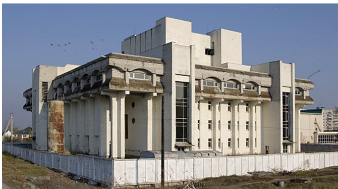
Будинок культури в Каневі до початку реконструкції

Працювали в Каневі робітники, яких спеціально привезли із Західної України. Ночували вони в гуртожитках і вагончиках, харчувалися абияк. Їх навіть підгодовували місцеві. Але робота кипіла: на неї не вплинули ані бурхливі події в Києві на Майдані, ані навіть новорічні й різдвяні свята. Процес особисто контролював черкаський губернатор Сергій Тулуб. Він відразу попередив: «Вже у березні 2014 року ми маємо зайти в оновлену, сучасну будівлю» 7 .