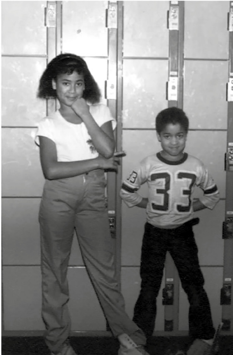
Skateland, мені шість років