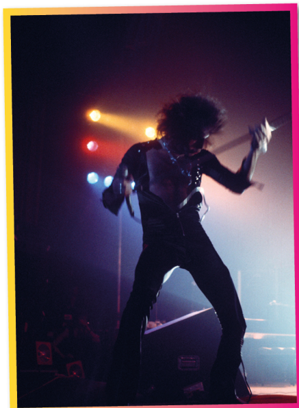
Зліва. Як завжди, блискучий. Hammersmith Odeon, листопад 1975 Справа. Завоювати світ. Live Aid, 13 червня 1985

Іноді я питаю себе, а що робив би Фредді Меркюрі зараз, якби дожив. Виступав би з Queen? Судив би шоу талантів на телебаченні? Писав би хіти для інших артистів? Аранжував би мюзикли на Вест-Енді? Пілососив би будинок у рожевому топі на каблуках? Чи насолоджувався б тихим життям, але під настрій діставав би корону й мантию? Хто зна, але впевнений, що він, як завжди, залишався б забавним, живим і блискучим.