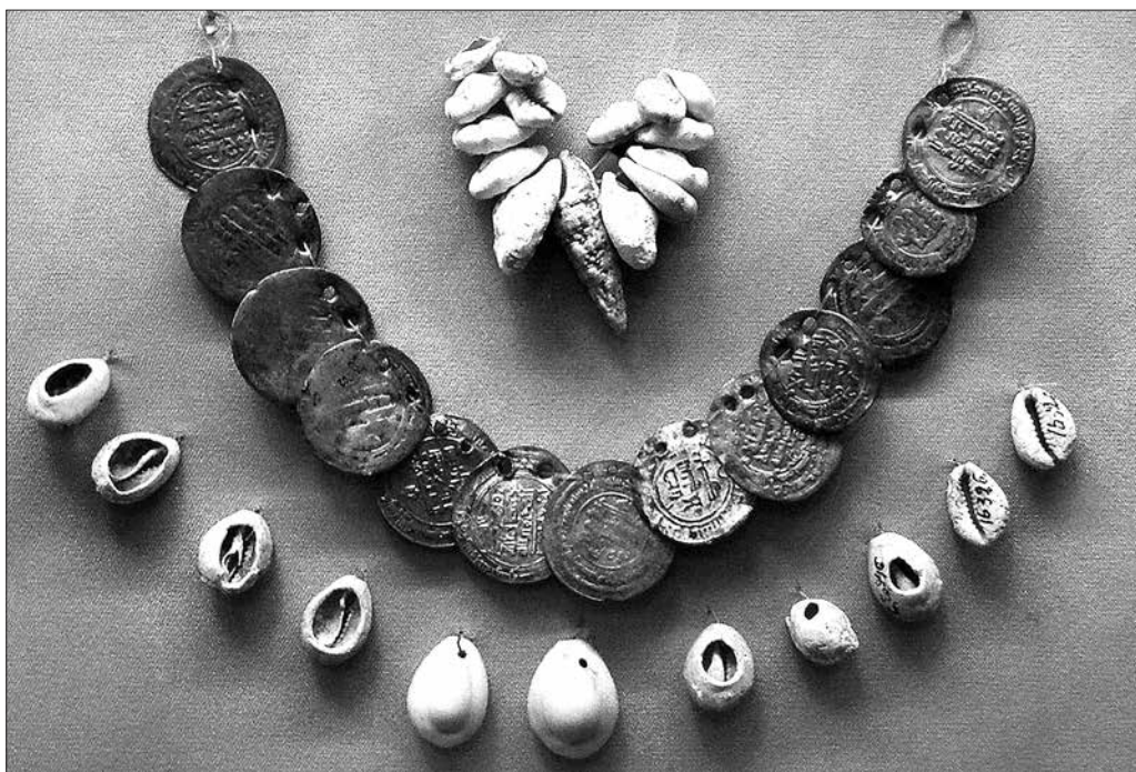
■ Упродовж кількох століть мушлі каури поруч із срібними арабськими дирхемами були в обігу на землях Русі. На фото — знахідка з поховання X ст., дослідженого на Середньому Дніпрі. Експозиція Національного музею історії України.

Перевагою металів було те, що їх можна було легко ділити на частини, а потім знову переплавляти. До того ж, метали не боялися вогню і не псувалися від зберігання. Зберігати їх можна було практично вічно.