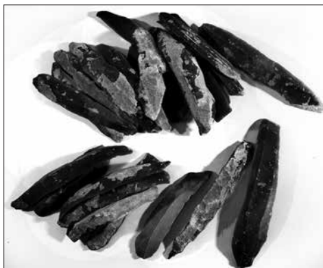
■ Скарб із кременевих пластин, Середнє Подніпров'я, трипільська культура, IV тис. до н. е. Кременеві пластини могли виконувати у кам'яному віці функції грошей. У цьому скарбі, знайденому у горщику, налічувалося 150 пластин, видобутих на Волині, за сотні кілометрів від берегів Дніпра.

Причому, як показують розкопані і досліджені археологами сто-