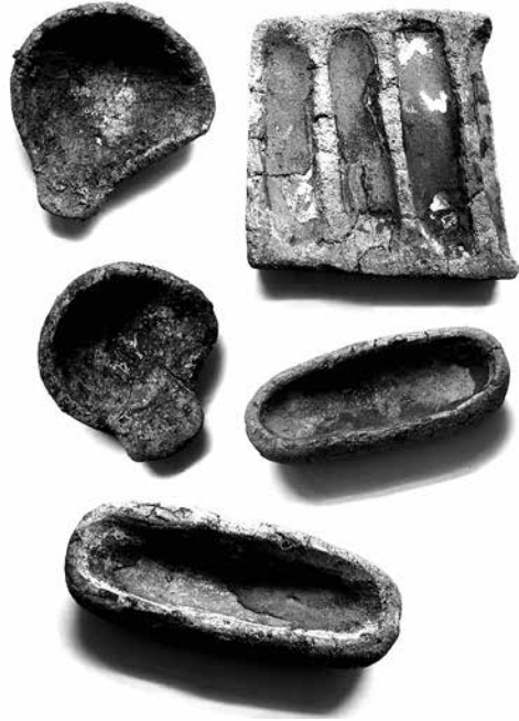
■ Набір форм та льячок із поховання ливарника, датованого першою половиною III тис. до н. е. на Херсонщині (катакомбна культура, розкопки А. І. Кубишева. Археологічний музей НАН України).

Ідея створення металевих грошей прийшла людям не одразу. Однак навчившись видобувати та обробляти метали, народи багатьох країн поступово стали використовувати метали як гроші. Причому метали виявилися настільки зручні для такого використання, що досить швидко витіснили більшість інших форм грошей.