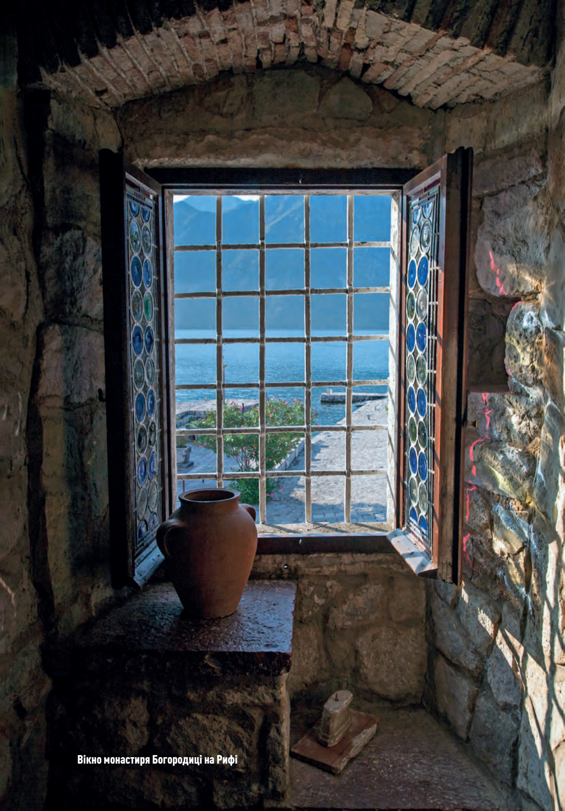
Вікно монастиря Богородиці на Рифі