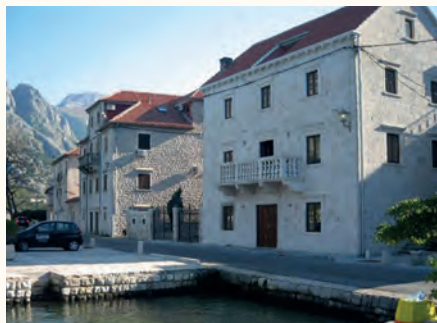
Палац Луковичів у Прчани

Невдовзі до Которської затоки увійшов британський флот. Чорногорці гостинно віддали під резиденцію його командувача палац Луковичів у Прчани. Британці допомогли чорногорцям захопити ос-