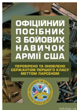
Офіційний посібник з бойових навичок армії США