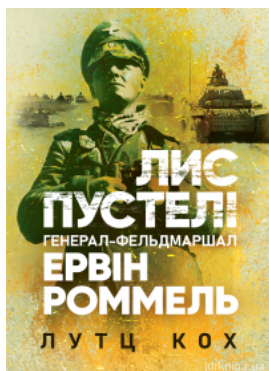
Лис пустелі. Генерал-фельдмаршал Ервін Роммель