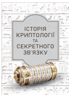
Історія криптології та секретного зв'язку