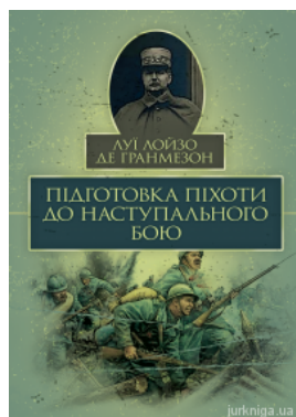
Підготовка піхоти до наступального бою