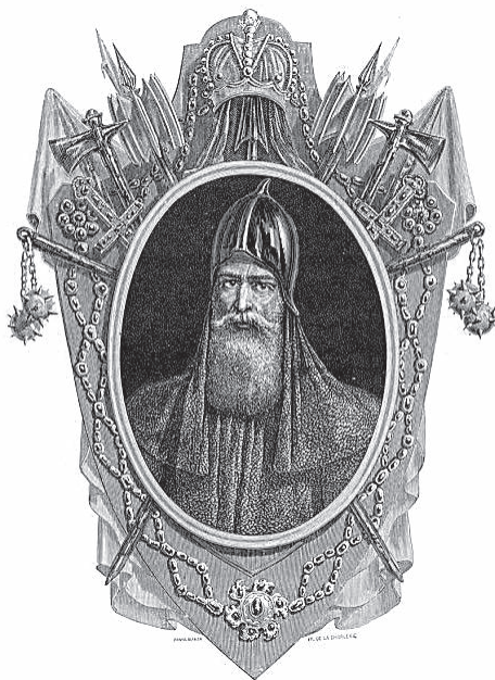
Князь Рюрик, батько київського князя Ігоря

Одразу скажімо, що ми вимірюємо й оцінюємо на побутовому рівні — фахівці так не вважають. Але на побутовому рівні це все зводиться до якогось безумного, незрозумілого протистояння князя Х князю У, які походили з одного й того самого коріння. Насправді йдеться про те, що всі ці землі були приватною власністю родини, у цьому разі родини Рюриків 4 . Деякі гілки ріднилися між собою, литовські Гедиміновичі — з «руськими» Рюриками. А коли вимерли Рюрики, то очевидно Гедиміновичі почали пред'являти права на їхню власність. Це як сьогодні в нашому приватному праві! Тоді так саме було. Держава — це умовна назва, яку ми використовуємо для зручності. У тій реальності це були просто приватні